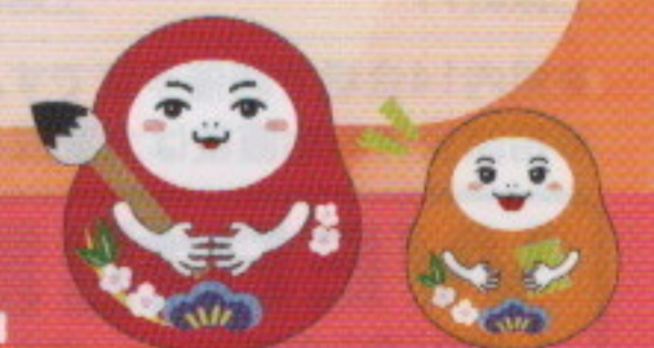
金沢地方法務局 相続登記促進イメージキャラクター 「つぐとなく」