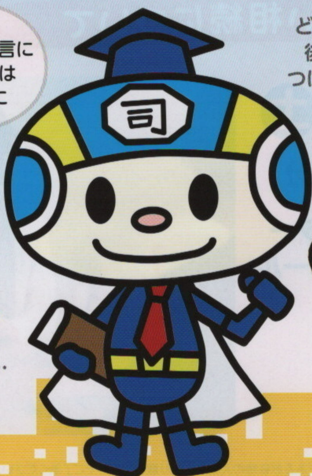
石川県司法書士会キャラクター「シホーマン」